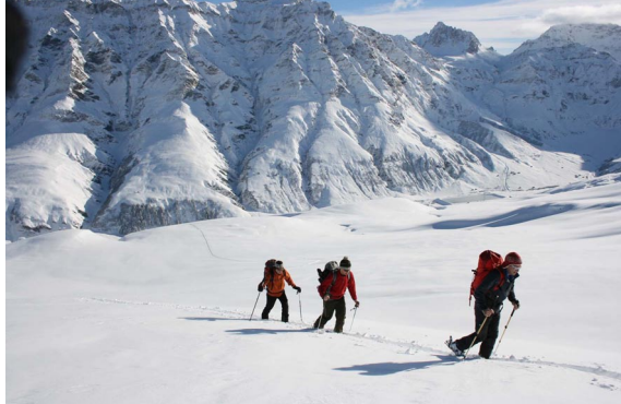
Bild recht: Abfahrt über unverfahrenen Hängen soweit das Auge reicht.

Bild Links: Frisch verschneite Winterlandschaft. Die Lawinengefahr ist erheblich. Trotzdem kann ein prächtiger Aufstieg zur Rotflue P. 2589 genossen werden.