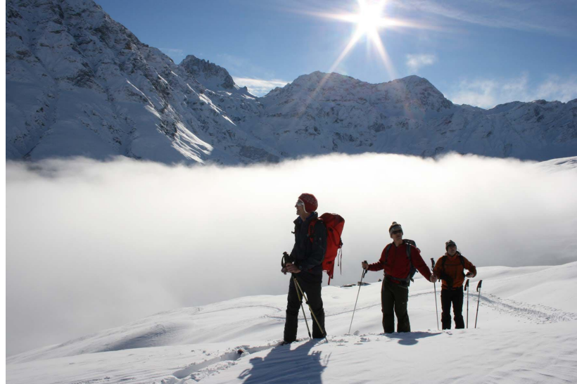
Im Safiental bleibt Zeit zum geniessen und staunen.