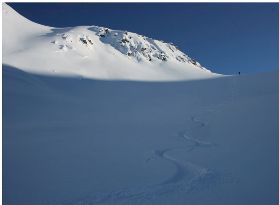
Bild rechts: Auch hier jungfräuliche Schwünge hinab von der Gipfelkuppe des Ettriastand ins Tal.

Bild links: Diese Pulvermulde hinab ins Chietal sollte nie enden! Die Sonnenseite des Schattens. Eine gewisse Suchtgefahr besteht allerdings.