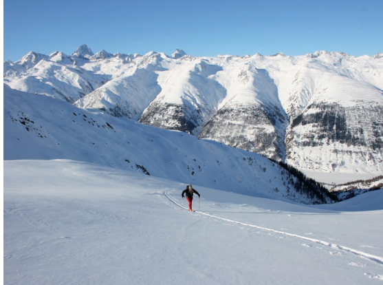
Bild rechts: Auf- und ausstieg aus dem Schatten des Chietal Richtung Teltschehorn.

Bild links: Vorfreude auf die Abfahrt. Einzige Spur im Aufstieg, daher auch erste in der Abfahrt! Dahinter die typische Landschaft des Goms. Am Horizont die dunkle Pyramide des Finsteraarhorns.