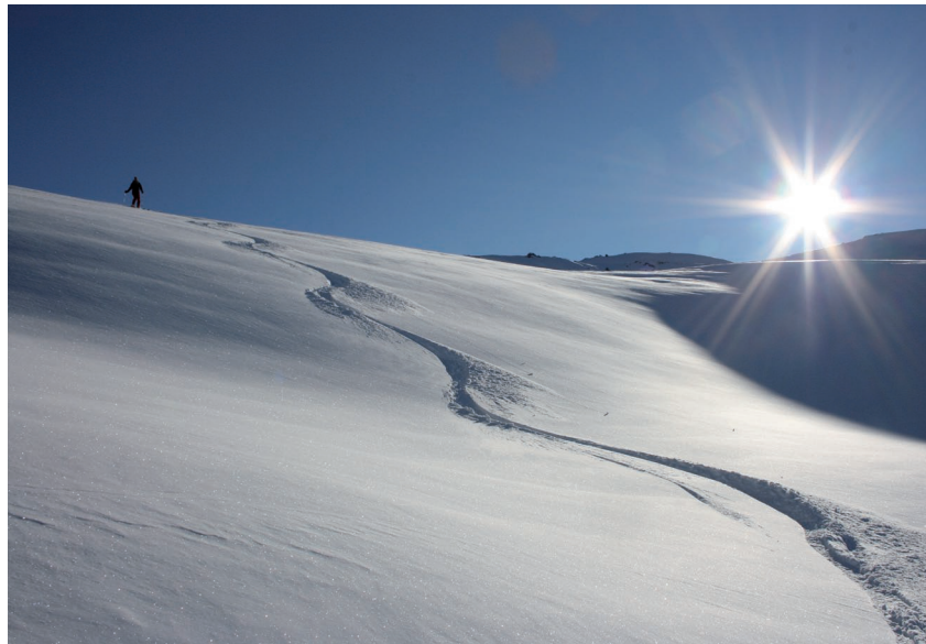
Unberührte Pulverhänge und wärmende Sonnenstrahlen verzaubern die kalte Winterlandschaft in ein Paradies der Hochgefühle.

Unsere beiden Skitourenvorschläge beginnen mit einem Waldabschnitt um später über Geländerücken dem Gipfelziel näher zu kommen. Oft liegt toller Pulverschnee an den Nordhängen und Mulden. Auf die Abfahrt darf man sich freuen!